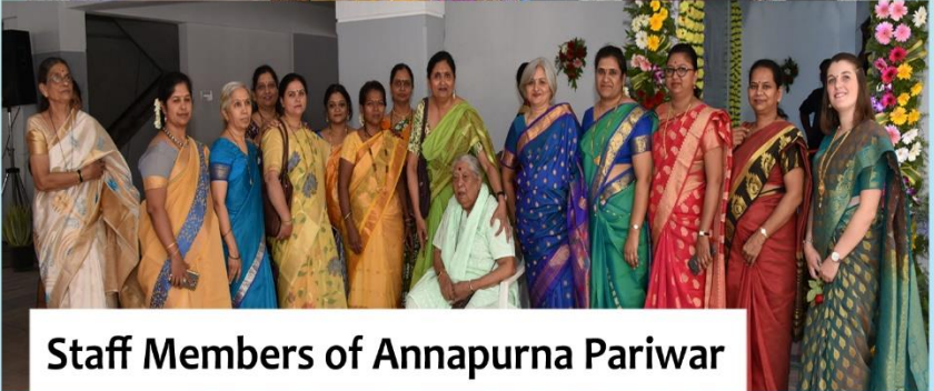
Staff Members of Annapurna Pariwar