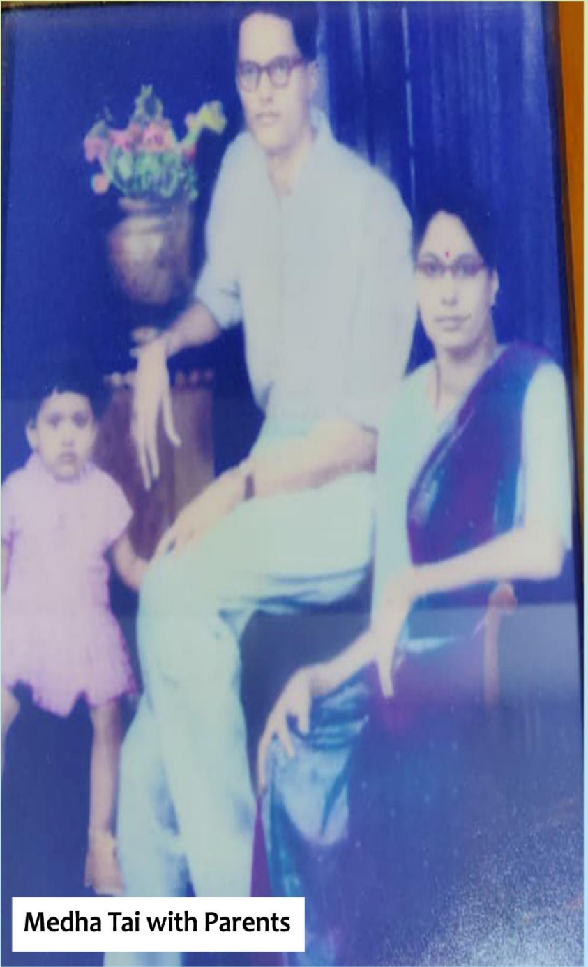
Medha Tai with Parents