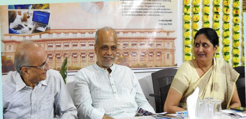
Lighter Moments with Board Members, Consultants & chief Guests of Annapurna Pariwar