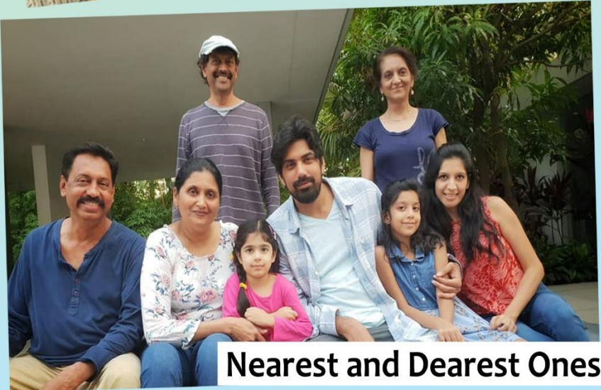
Nearest and Dearest Ones