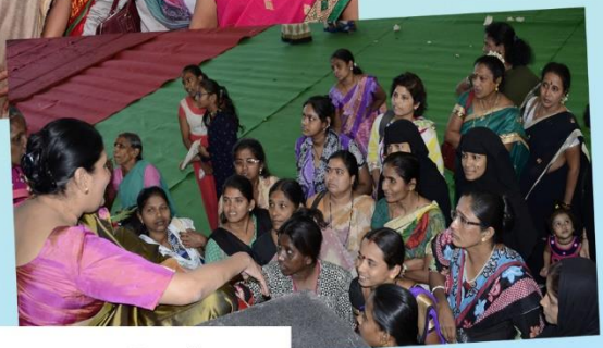
Members of Annapurna Pariwar