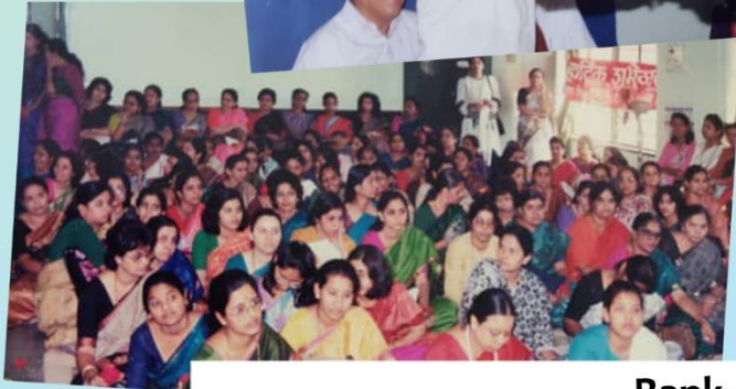
Bank of India + All India Bank Employees Association