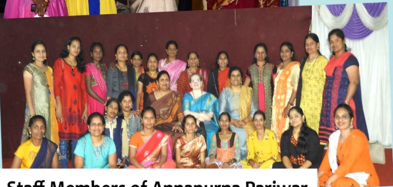
Staff Members of Annapurna Pariwar