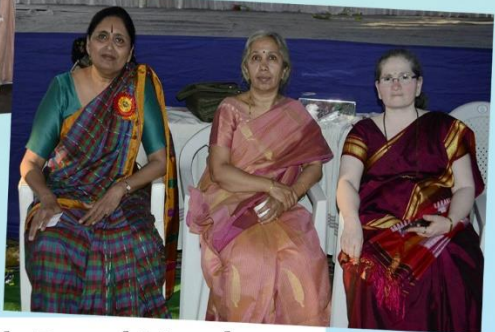
Lighter Moments with Board Members & Consultants of Annapurna Pariwar