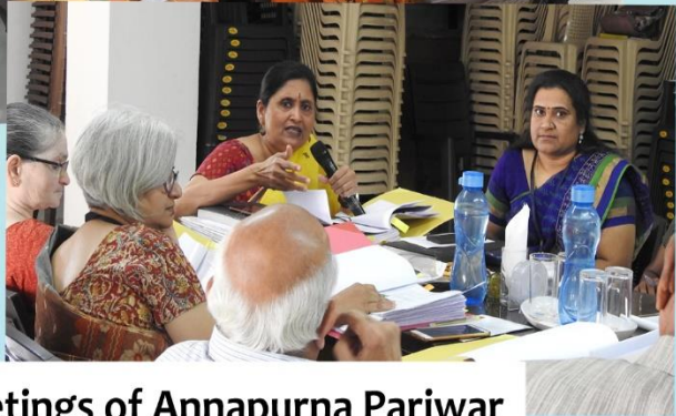
Board Meetings of Annapurna Pariwar