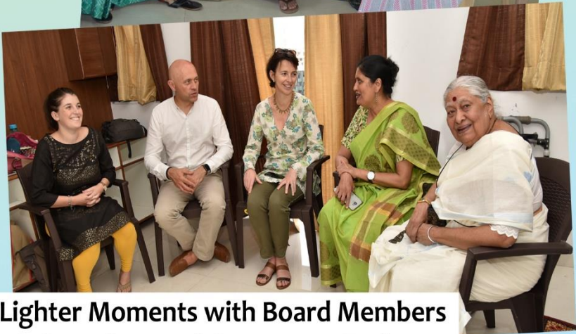
Lighter Moments with Board Members & Consultants of Annapurna Pariwar