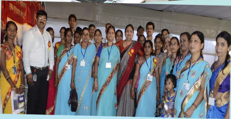
Annapurna Pariwar - Community Representatives