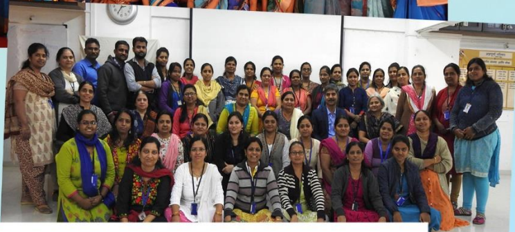
Staff Members of Annapurna Pariwar