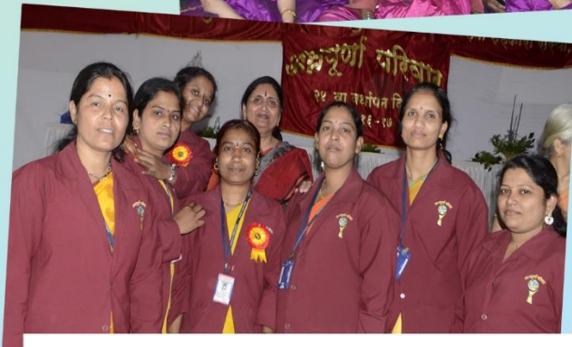
Staff Members of Annapurna Pariwar