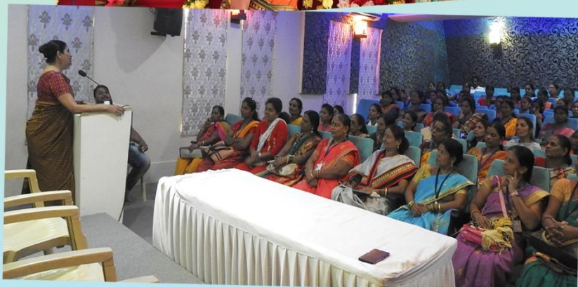
Annapurna Pariwar Community Representatives