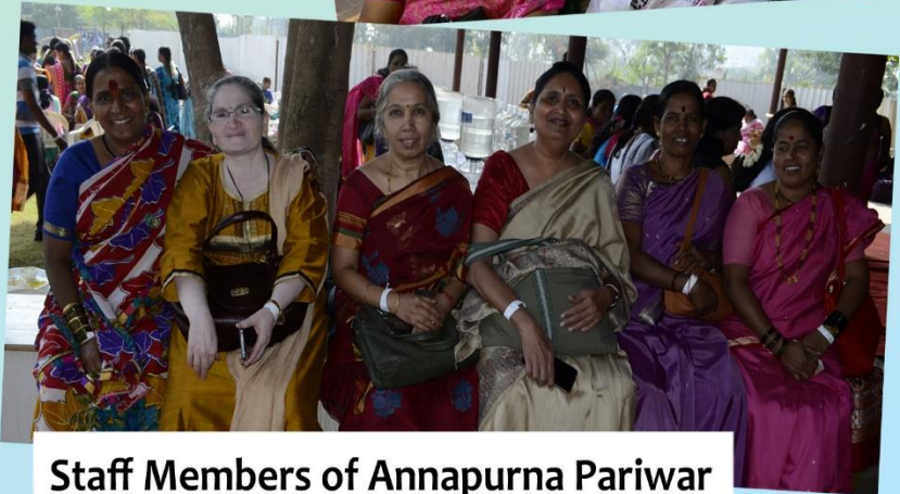
Staff Members of Annapurna Pariwar